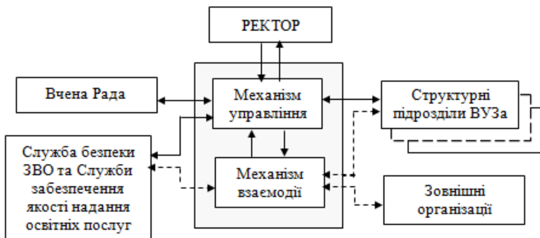
Рис. 3. Система взаємодії служби безпеки з внутрішніми та зовнішніми суб'єктами системи економічної безпеки закладів вищої освіти