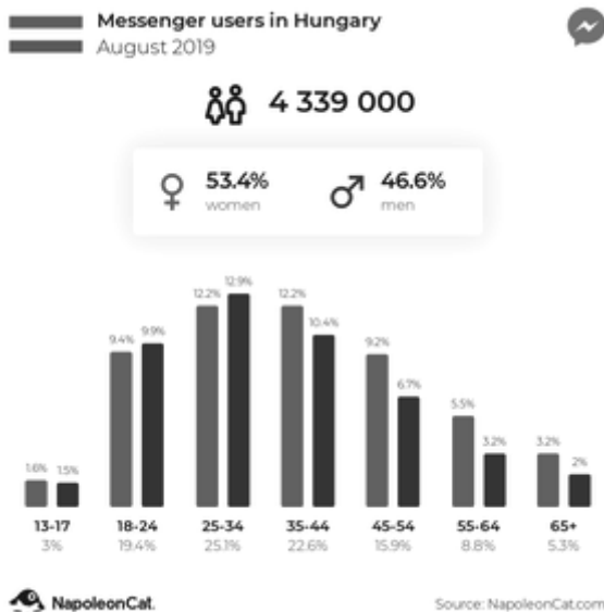
Рис. 2. Дані про користувачів Messenger у 2019 році в Угорщині

Messenger також дуже популярний в Угорщині, з точки зору маркетингу соціальних медіа. На цій платформі охоплюються користувачі, які відсутні у маркетингу на Facebook.