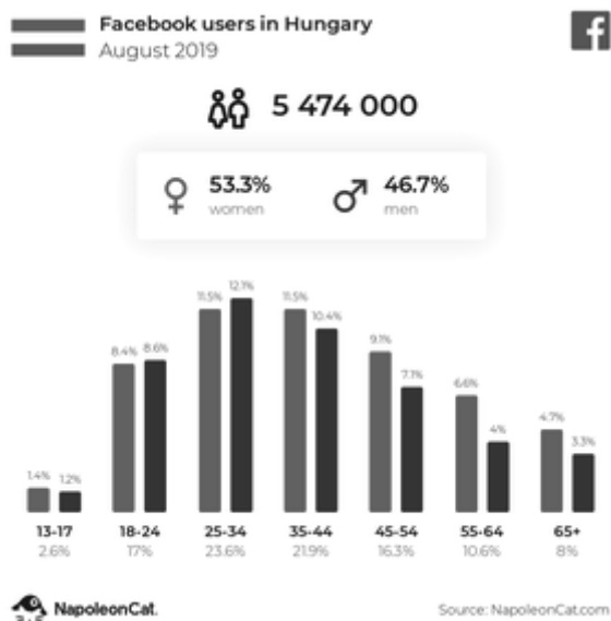
Рис. 1. Дані про користувачів Facebook у 2019 році в Угорщині

Facebook – одна з найкращих платформ соціальних медіа, яку бізнес може використовувати для досягнення свого цільового ринку – незалежно від того, до кого вони належать. Незалежно від статі та віку, давайте подивимося на останні дані користувачів Facebook у 2019 році в Угорщині.