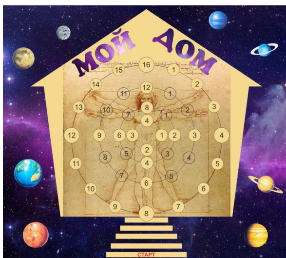
Рис. 2. Ігрове Поле Трансформації

На другому етапі гра продовжується в Полі Трансформації (рис.2). Основою поля трансформації даної гри є мандала із головними символами Самості (вітрувіанська людина Л. да Вінчі, дім, дерево), які створюють електромагнітне поле тяжіння синхронічності подій. Для досягнення цілісної завершеності у грі пропонується поетапна трансформація в 3D-стратегії: «Моя Мрія» – «Мої Корні» / «Мое Ім'я» – «Мое Діло».