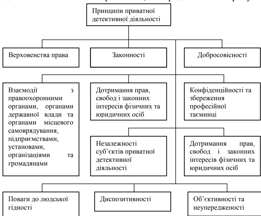
Рис. 2. Основні принципи здійснення приватної детективної діяльності

І в той же час, існуючий світовий досвід, який показує, що приватна детективна діяльність набула широкого розвитку в багатьох країнах в тому числі в США, ЄС, Японії і інших. У цих країнах послуги приватних детективів користуються великим попитом, методи їх роботи вельми ефективні, що наочно проявляється в досягнутих результатах і задоволеності клієнтів. Тому використання світового і вітчизняного досвіду приватної детективної діяльності в системах економічної безпеки є одним з найбільш перспективних напрямків в їх розвитку. Однак слід враховувати, що ні в теоретичному ні в практичному плані ця проблема вітчизняними вченими і фахівцями в галузі забезпечення економічної безпеки глибоко не розглядалася. Тому впровадження технологій приватної детективної діяльності є новим, інноваційним напрямком в розвитку діючих систем економічної безпеки підприємств. Будучи складним напрямком професійної діяльності в сфері економічної безпеки приватна детективна діяльність здійснюється на основі принципів, які представлені на рисунку 2.