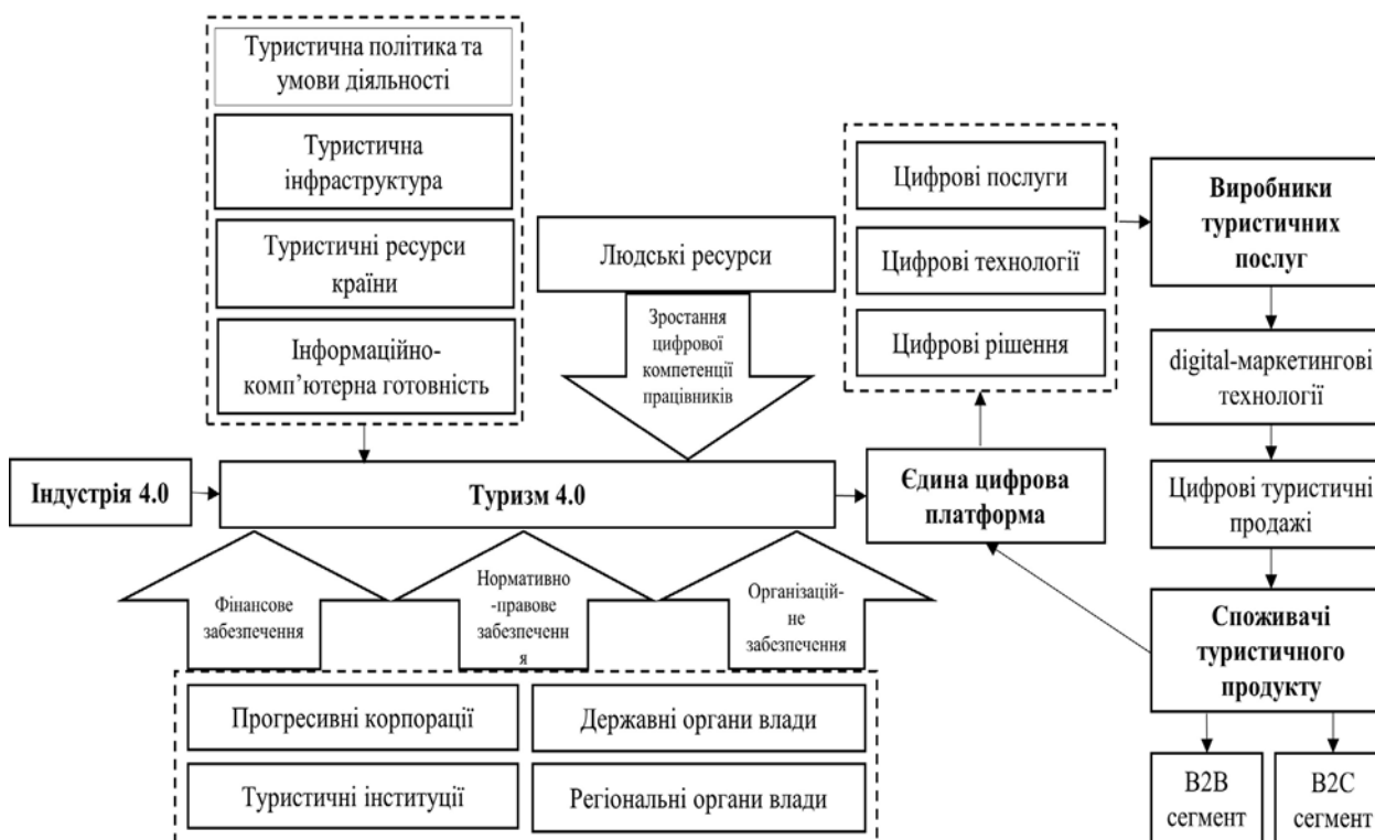
Рис. 1. Удосконалення цифрової моделі туризму під впливом трансформаційних процесів в економіці