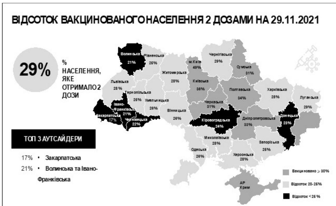
Рис.1. Відсоток вакцинованого населення України 2 дозами станом на 29.11.2021

Станом на 29.11.2021 року від початку кампанії з вакцинації в Україні було зроблено 24 288 230 щеплень. За весь період вакцинальної кампанії вакциновано однією дозою-35% населення-13 320 530 осіб, вакциновано двома дозами 29% населення-10 967 700 осіб.