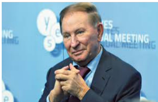
Фото Л.Д. Кучми

Уважно вивчаючи світлини Кучми під час виступу перед публікою або на телебаченні, можна зробити такі висновки.