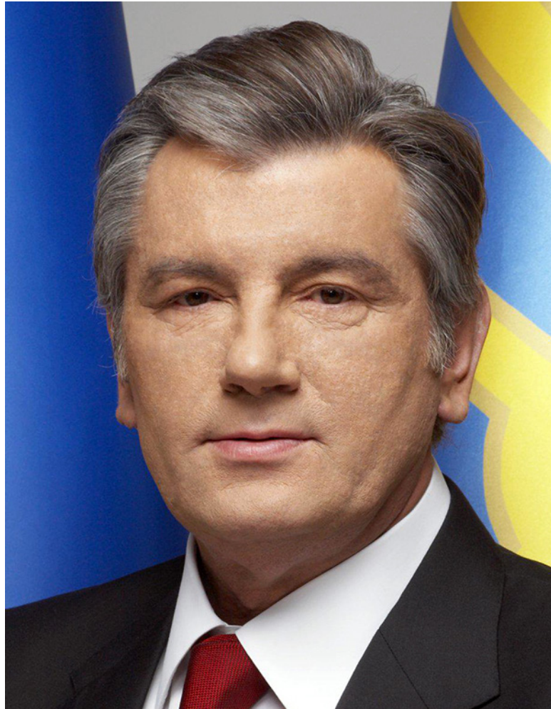
Фото В.А. Ющенко

Ширина його обличчя становить більше 70 відсотків від довжини, це означає, що від природи він упевнений у собі. Брови розташовані високо, це говорить про те, що більш розвинені м'язи, які піднімаються при вираженні подиву. Такі люди віддають перевагу особистому простору. Очі розташовані широко, це означає, що він більш терпимо ставиться до помилок інших.