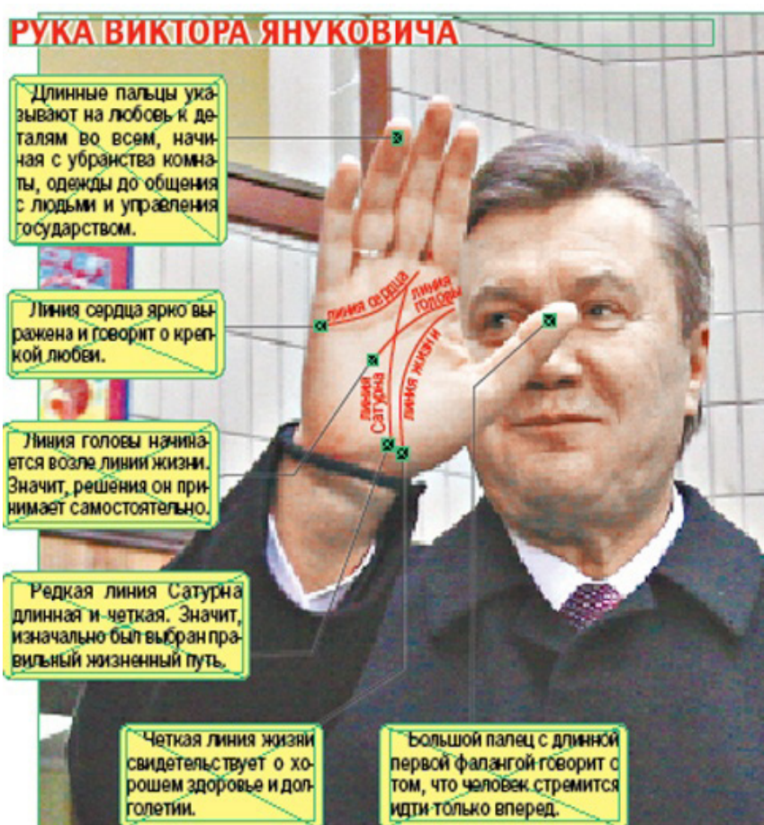
Рука В.Ф. Януковича

консерватизм. Другий - великий пагорб Меркурія, який вказує на завидні комерційні здібності, економічну хватку, а також сповіщає про те, що він уміє самовиражатися, бути комунікабельним, йому притаманні духовність та релігійність. Потужний пагорб Юпітера вказує на його сильну владу, показує, що він людина амбіційна, має акцентовані лідерські якості, його Я надзвичайно розвинуте. Пагорб Сатурна говорить про високий інтелект та розумовий розвиток, він здатний серйозно підходити до вирішення проблем, має тяжіння до науки, досліджень.