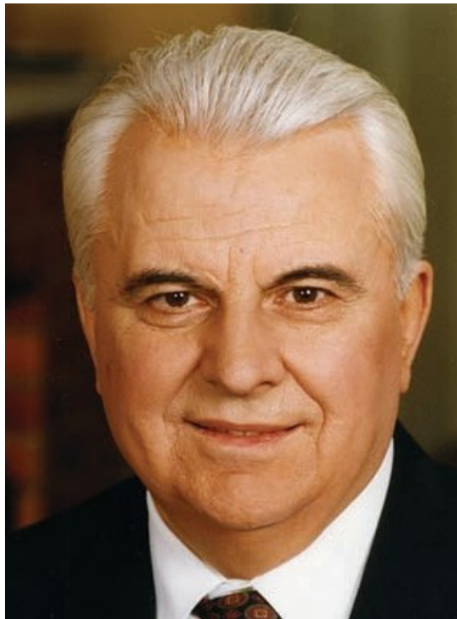
Фото Л.М. Кравчука

А.Ф. Лазурський виділяв три психологічні рівні залежно від ступеня пристосування людини до середовища. Нижчий рівень - це погано пристосовані люди; середовище накладає на них особливо сильний відбиток, насильно пристосовуючи до своїх запитів і майже незважаючи на їх вроджені особливості. Середній - здобуття людиною місця в навколишньому середовищі й використання її у своїх цілях. Вищий - рівень творчості, коли людина прагне середовище переробити. Вищий рівень, до якого ми відносимо Л. Кравчука, той, якому притаманні: свідомість; скоординованість душевних переживань; вищі людські ідеали і т.п. Типи-ідеали вищого рівня поділяються за змістовними показниками: альтруїзм; знання індуктивне / дедуктивне, краса, релігія, суспільство, держава, зовнішня діяльність, ініціатива, система, організація, влада, боротьба [13].