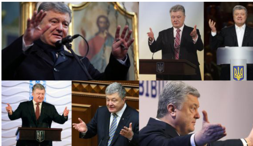
Фото П.О. Порошенка

Але є питання - чи це природний жест, чи результат тренувань з технології правильних жестів. Можливо, Президентіві порадили використовувати такі рухи, аби свідомо створювати позитивний імідж.