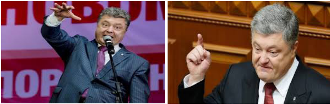
Фото П.О. Порошенка

Однак, невербальні елементи є показовими для аналізу щирості політичних лідерів, їх мотивів та прихованих намірів.