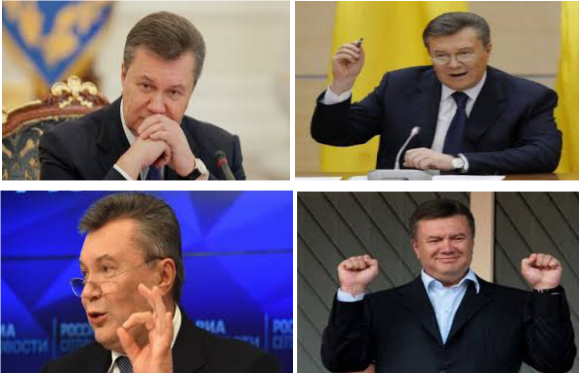
Фото В.Ф. Януковича

Він узяв класифікацію Н. Смирнової в якості базисної, змінивши її лише в одній деталі. Більшу частину мімічних рухів відніс не до комунікативних, а до модальних жестів. Міміка дозволила оцінювати істинність тих чи тих реакцій В. Януковича залежно від контексту.