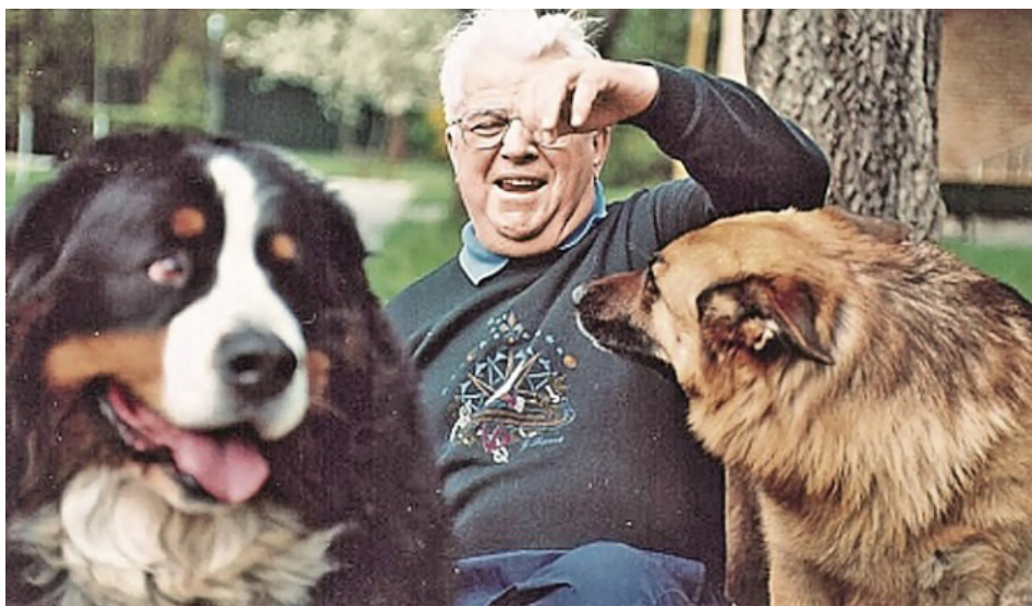
Фото Л.М. Кравчука

Свого часу в нього була московська сторожова вівчарка. Американські психологи показали, що собак, які можуть нести службу і захистити господаря, вважають за краще люди авторитарного складу, неусвідомлено прагнуть підпорядкувати собі інших, люди з нереалізованими лідерськими якостями (але серед них зустрічаються особи з високим рівнем тривожності). І на останок, про людей і тварин. Кравчук любить собак. Леонід Кравчук сів на карантин і заявив про референдум.