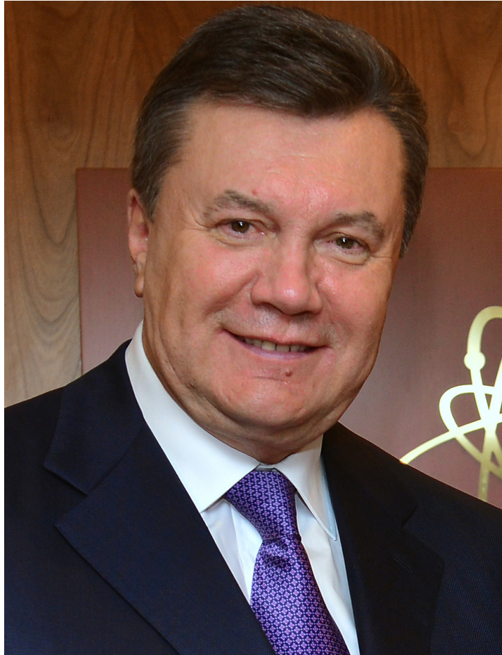
Фото В.Ф. Януковича

Чотирикутний тип особи - показник натури енергійної, грубої, різкої, дуже впертої, характеру твердого, що доходить до непохитності й навіть дуже часто жорстокості. Люди цього типу відрізняються дуже рішучими ідеями, вони небагатослівні й різкі у своїх судженнях. Критикуючи ідеї інших, вони не переносять протиріччя, схильні нав'язувати свої думки іншим. Спритні резонери, їх логіка стисла і могутня, дуже часто перекручена манією протиріччя, що легко призводить їх до гніву. У них особливо розвинений практичний сенс, позитивізм їх розуму знищує деякі пориви ідеалізму. Систематичний склад розуму змушує їх усе робити в міру.