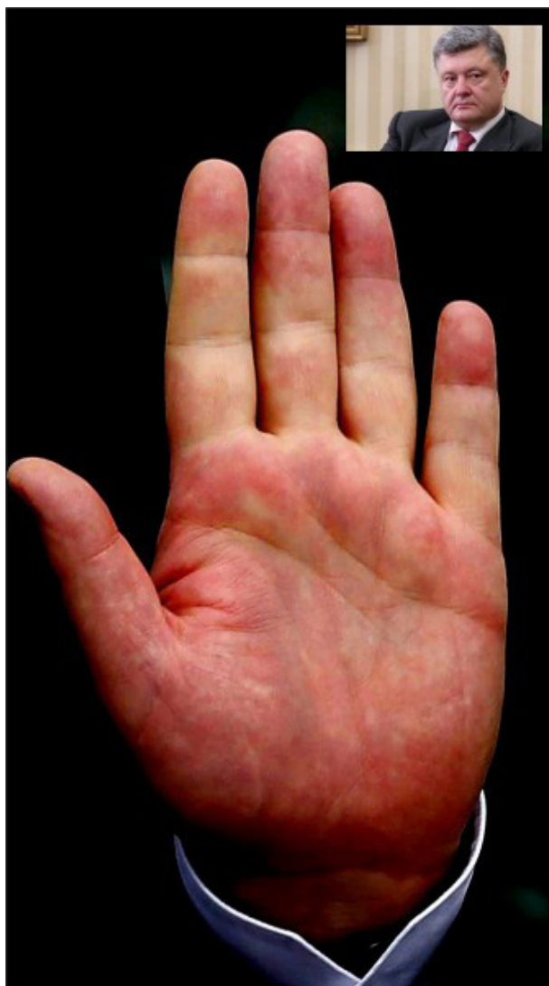
Фото руки П.О. Порошенка Рука Землі (квадратна) в чистому вигляді зустрічається досить

Ширина долоні земної руки трохи менша її довжини або дорівнює їй. Така рука виглядає сильною, вона характерна для людей, здатних до наполегливої фізичної або інтелектуальної праці. Руки Землі виглядають чіткими й правильними, й основними рисами особистості, якій вони дісталися, є міцність та надійність (незважаючи на інші позначки, такі, як, наприклад, конічні кінчики пальців або високі пагорби). Володарі квадратних рук, як правило, підтримують стосунки з відданими товаришами, які їм повністю довіряють. Як працівники, вони звикли до наполегливої праці й повністю заслуговують довіри.