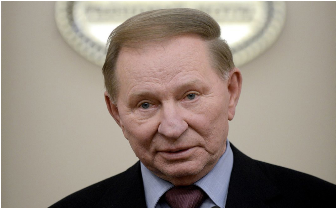
Фото Л.Д. Кучми

В Інтернеті є безліч світлин з портретом Л. Кучми, для нашого аналізу візьмемо одну з них.