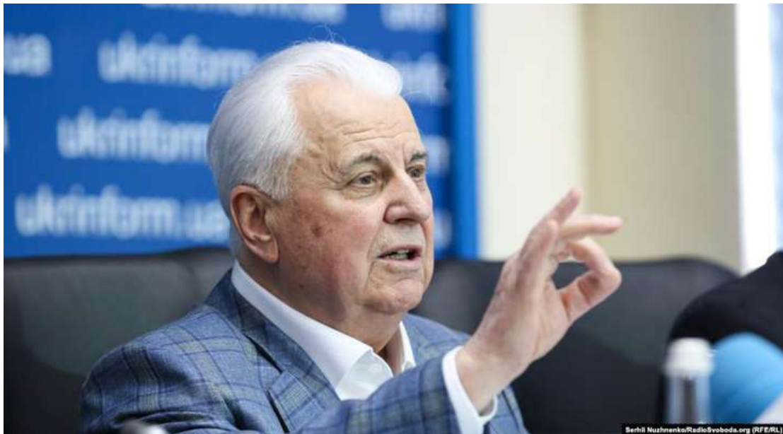
Фото Л.М. Кравчука

Такі жести були у Л.М. Кравчука, коли він був першим заступником завідуючого відділом пропаганди ЦК Компартії України. Разом з ним, зліва направо: Плохій Валерій - секретар ЦК ЛКСМ України, Житеньов Володимир - секретар ЦК ВЛКСМ, Ганічев Валерій - головний редактор газети «Комсомольська правда», Моргун Федір - перший секретар Полтавського обкому Компартії України та кращі комбайнери області. Літо 1978 року. Дні газети «Комсомольська правда» у Полтавській області.